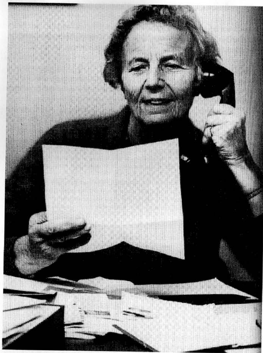
Elise Ottesen-Jensen reste runt i Sverige och föreläste om olika frågor som berörde både psykiska och fysiska sidor av samlevnad och sexualitet. Bilden ur Ottesen-Jensens memoarer 1886-1966 - Livet skrev.

Jag kom precis lagom till Folkets Hus för att se att många av kvinnorna hade tårar i ögonen när det kom ut. Fru Jensen hade en liten sentimental ådra, så tanterna grät ofta efter mötena. Hon var mycket folkvän. [...] Men hon hade också mäktiga fiender. Då hon stod i talarstolen och talade om födelsekontroll var det en brottslig handling som kunde medföra straff. [...] Det var en upplevelse att lyssna till fru Jensen. Hon var en fängslande föredragshållare där hon stod i talarstolen, en spröd kvinna med eld i blicken och en energi utan like. Ett av ämnena fru Jensen tog upp den där kvällen var "min" fråga, homosexualiteten. Det var för den sakens skull jag gick fram och pratade med henne efteråt.