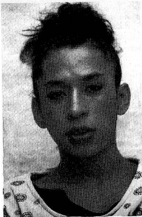
Chispa. Omslagsbildet till Annick Prieurs bok Iscenesetelser av kjønn. Transvestitter og machomen i Mexico by.

En kan vel kanskje si at Dr. Ruffs metodiske tilnærming til spørsmålet vitner om en begynnende vitenskapeliggjøring. Uttrykket på seksualitetens område er eldre enn vitenskapen, men den leder utvilsomt til nye former for