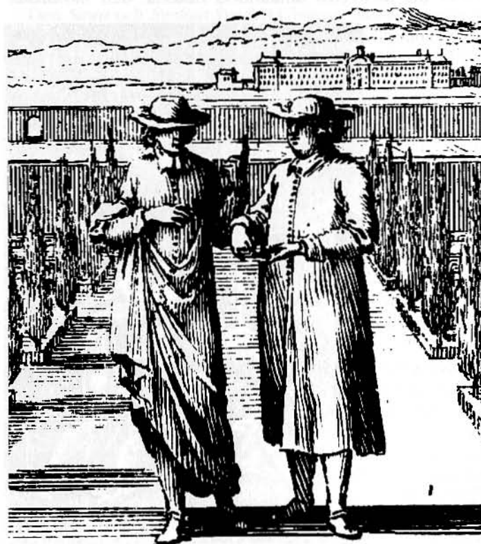
Abbé de Choisy bar sin kyrkliga skrud på ett kvinnligt sätt. de Choisy var heterosexuell, men känd för sin klädfetischism.

Varken folk eller kyrka såg med andra ord med överseende på manlig homosexualitet under medeltiden. Om någon i bikt erkände att han haft sådant för sig, skulle han få göra bot. Det var en skymf om en man blev