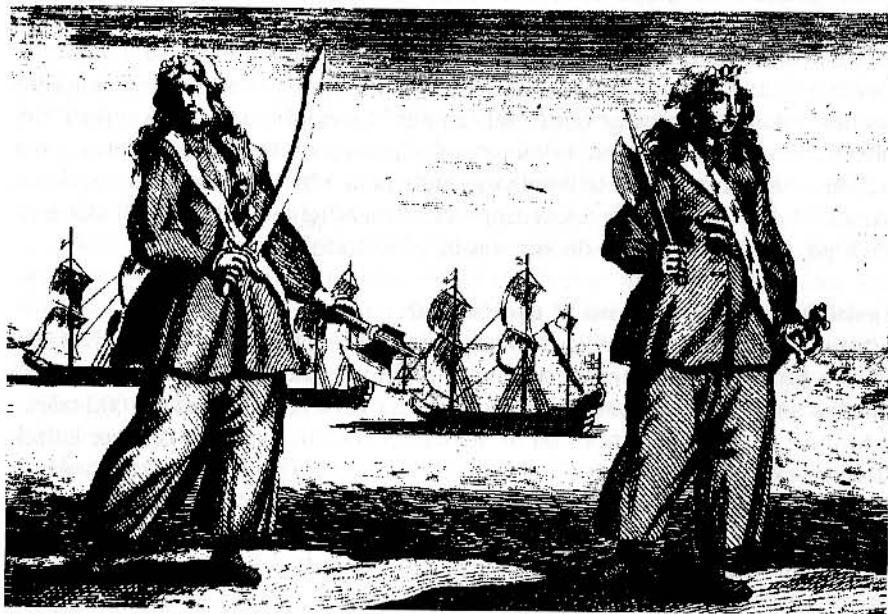
Anne Bonny och Mary Read, kvinnliga sjörövare på 1700-talet, vars vänskap var så intim, att det åtminstone för en utomstående betraktare såg ut som om de också hade en kärleksrelation.