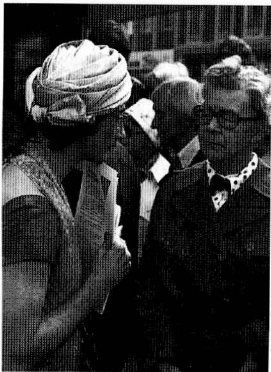
Bøssekaravanen i Esbjerg 1977.